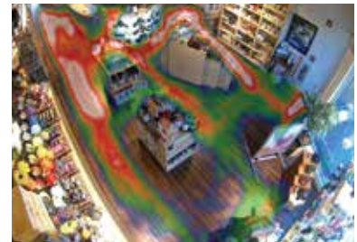
ความเข้าใจในภาพรวม (แผนที่บริเวณยอดนิยม)