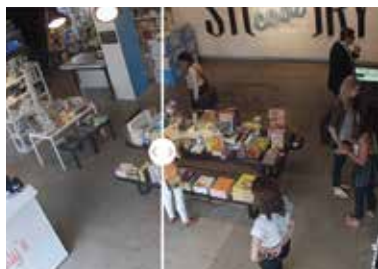
การป้องกันความเป็นส่วนตัว