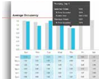
การวิเคราะห์การอยู่ในจุดใดจุดหนึ่ง