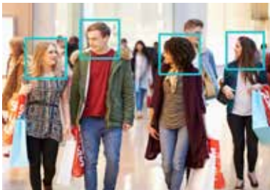
การนับจำนวนคน