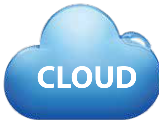
พื้นที่จัดเก็บคลาวด์