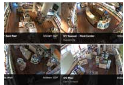
การเปรียบเทียบพื้นที่และร้านค้า