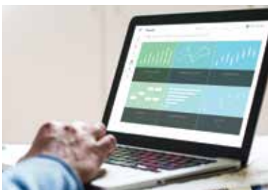
รายงานแบบละเอียด/ส่วนบุคคล