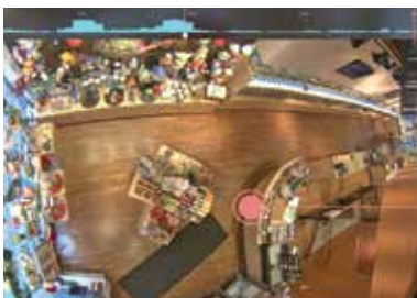
การบริหารจัดการพนักงาน